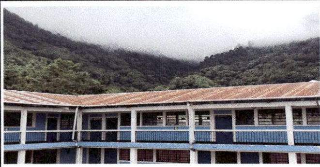
Foto 1. La lamina del techo de la escuela, el oxido está avanzando en la parte exterior, por lo que se pretende aplicar pintura, para que tenga mas durabilidad, medidas 10 M ancho X 52.50 M largo, equivalente a 525 M2