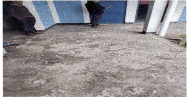
Foto 2. La torta de cemento de los corredores de la escuela en la mayor parte, se esta deteriorando, por lo que se pretende colocarle el piso de granito, para una que no se sigue arrinando, medidas 50x2.20, equivalente