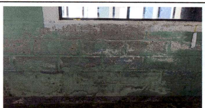
Foto 6. Las paredes de dos aulas se encuentran en malas condiciones, por humedad, por lo que se realizará el repello respectivo, para tener mas durabilidad, contiene las medidas de 38 M ancho por 2.50 M largo. 95 M2

Observación: Si es necesario se pueden agregar hojas adicionales y actualizar el número de hojas.