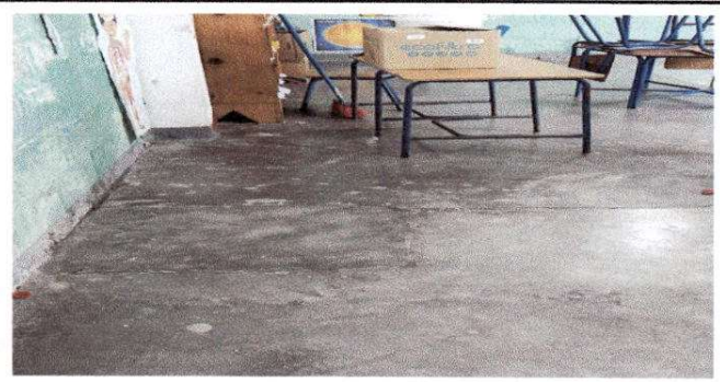
Foto 4. El piso de un aula ya contiene grietas, por lo que se colocará piso ceramico, para una mejor ambientación de los niños, la cual contiene las siguientes medidas. 7m largo por 5m de ancho equivalente a 35 M2.