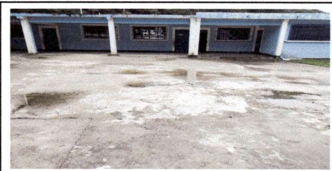
Foto 5. La torta de cemento del patio de la escuela esta perdiendo la fuerza, por el deterioro del mismo, por lo que se realizará su reparación, para el beneficio de los niños, medidas: 15 mts x 15 mts, equivalente a 225